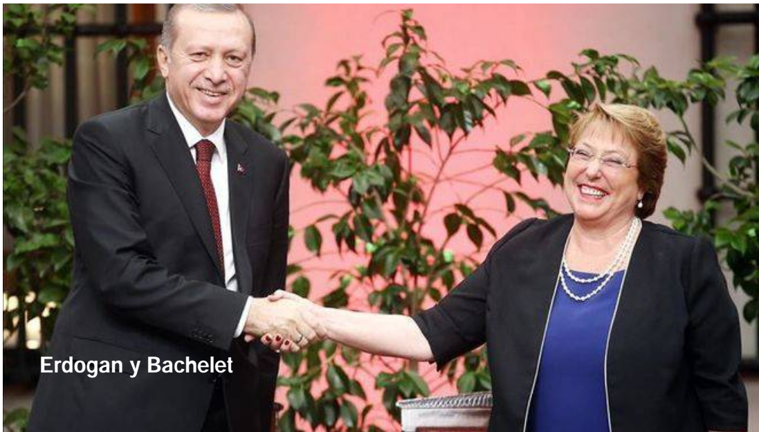
Erdogan y Bachelet

El presidente de Turquía , Recep Tayyip Erdogan, llegó el 31 de enero a Chile en el inicio de una gira que lo llevó también a Perú y Ecuador . La agenda del Jefe de Estado en Chile incluyó una reunión con la presidenta Michelle Bachelet, y una conferencia en la sede de la Comisión Económica para América Latina y el Caribe (Cepal). El gobernante también participó en el tercer encuentro empresarial Chile-Turquía, organizado por la Sociedad de Fomento Fabril (Sofofa). Erdogan repasó con Bachelet la