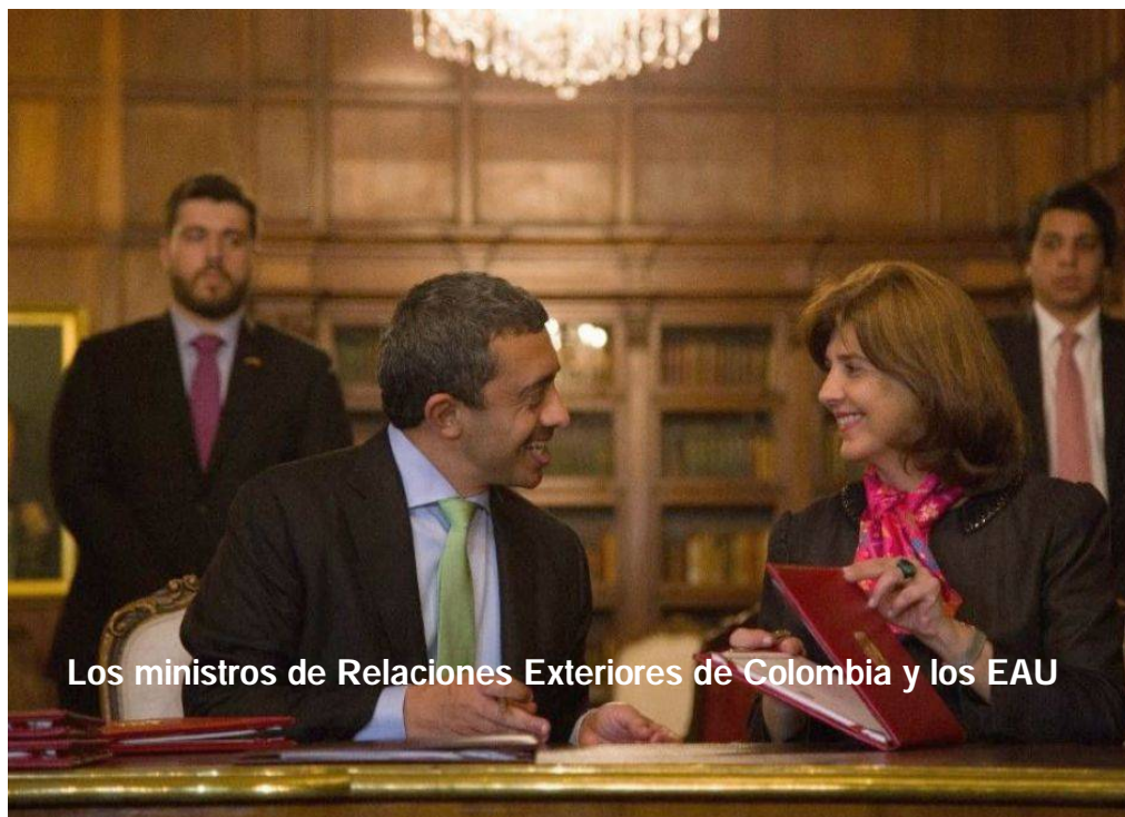
Los ministros de Relaciones Exteriores de Colombia y los EAU

Una nueva etapa en las relaciones entre la República de Panamá y los Emiratos Árabes Unidos inició—en el marco de la gira de Al Nayhan—con el establecimiento de un Comité Conjunto de Cooperación, suscrito por la Vicepresidenta y Canciller Isabel de