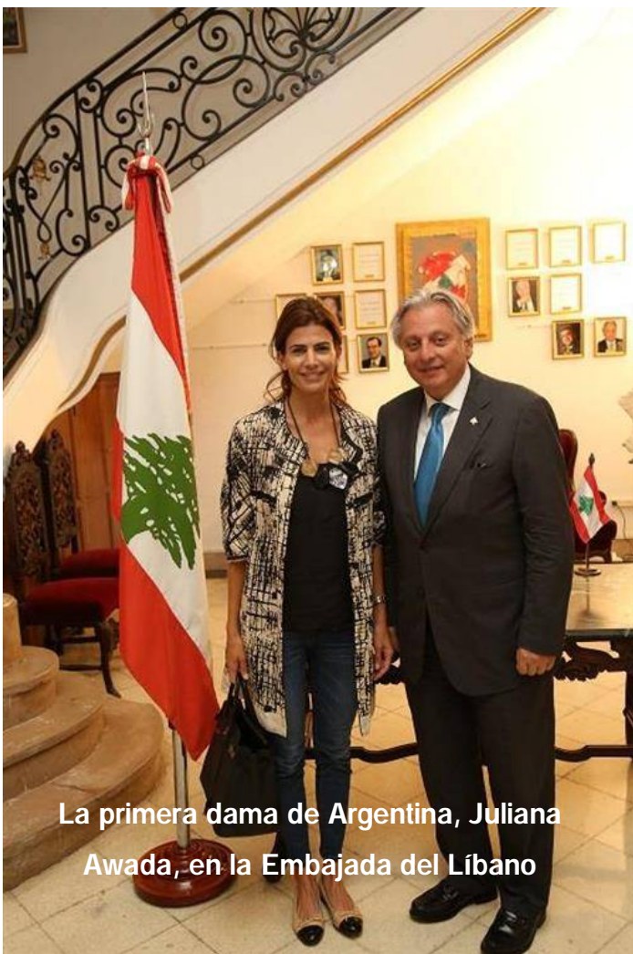
La primera dama de Argentina, Juliana Awada, en la Embajada del Líbano

Sheij Khalifa Bin Zayed al Nahyan, por su contribución al desarrollo y la promoción de las relaciones bilaterales. El diplomático argentino recibió la medalla de manos del canciller emiratí Abdallah Bin Zayed al Nahyan durante una ceremonia que se llevó a cabo en la sede del Ministerio de Relaciones Exteriores y Cooperación Internacional. El embajador argentino expresó su agradecimiento al presidente emiratí, y valoró muy positivamente la cooperación de las autoridades del país árabe, que ha permitido que su misión haya sido exitosa.